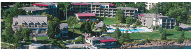
Bar Harbor Regency, Bar Harbor, Maine

http://www.ri7790.org/fr/activities/conference.asp