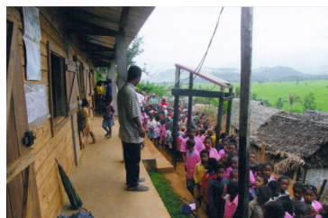
École construite en 2006 (févr. à juin) et l'appel des groupes. Ambalahondro, octobre 2006