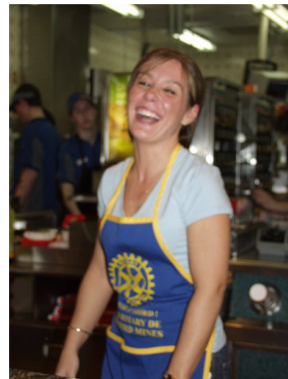
Oups! un peu hors foyer, mais le plaisir est là.